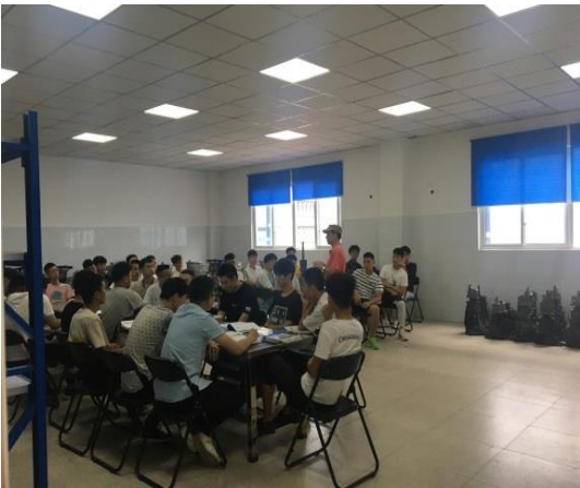
汽车工程学院课堂

教学内容力求体现职业性，重点比较突出，能够运用多媒体、板书恰当地展示教学内容，教学组织、课堂管理比较好。实训课程准备比较充分，项目内容具体，组织有序，讲解示范安排合理，基本上能达到学生实训的预定目标。针对个别教师在教学组织和授课内容上存在的问题，已反馈教学单位，通过和老师交流沟通，任课教师能虚心听取意见，表示要不断完善自己的教学。