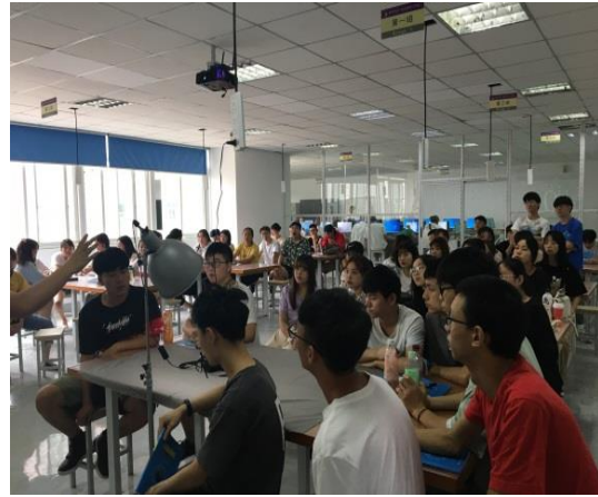
信息工程学院课堂